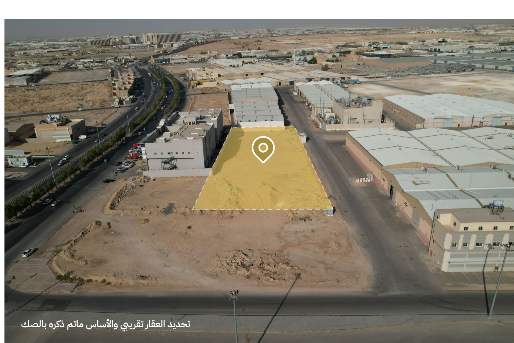
تحديد العقار تقريبي والأساس ماتم ذكره بالصك